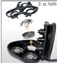
2. sz. fotó

A kések és a sziták olyan üzemeltetési kellékek, amelyeket rendszeresen cserélni kell. Nem tartoznak a garancia hatálya alá