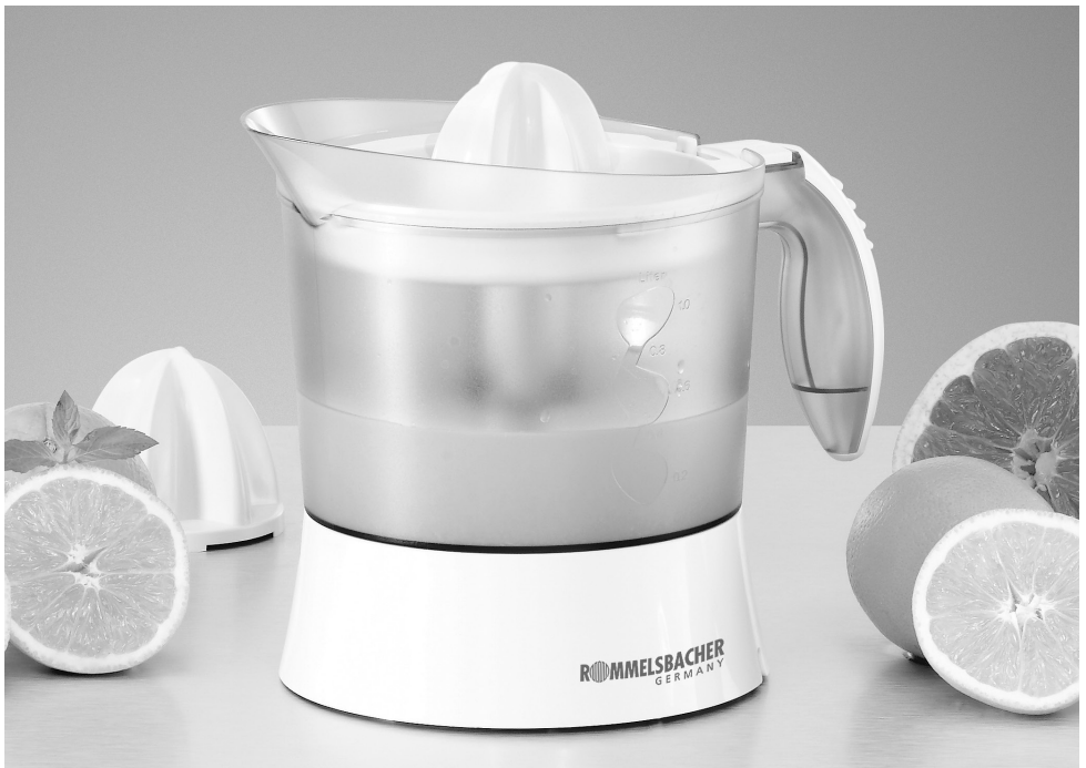
ZP 40 Elektrische Zitruspresse Electric Citrus Juicer