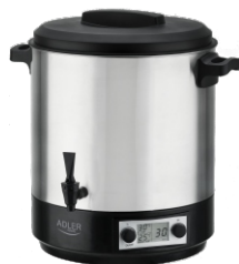
PASTEURIZATION POT AD 4496