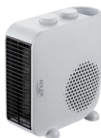
FAN HEATER AD 7725