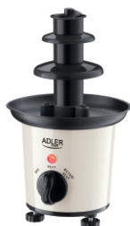
CHOCOLATE FOUNTAIN AD 4487