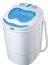
Washing machine MS 8053