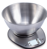
Kitchen Scale MS 3152