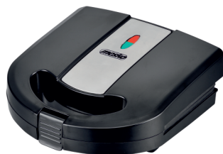
Sandwich Maker MS 3045