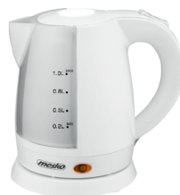
Electric Kettle MS 1276