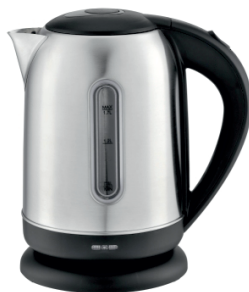
Electric Kettle MS 1288