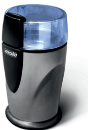
Coffee Grinder MS 4465