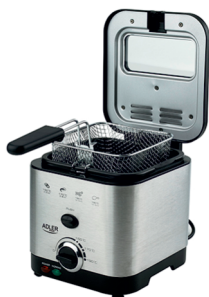
Deep Fryer 1,5L MS 4911