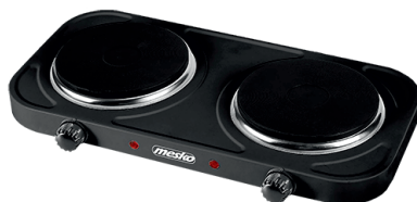
Double hot plate MS 6509