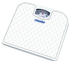
Bathroom scale MS 8160