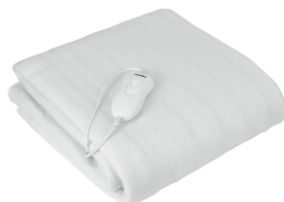
Heating Blanket MS 7419