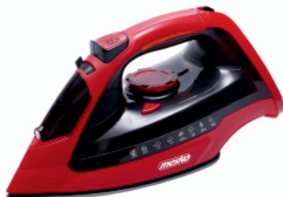
Steam Iron MS 5031