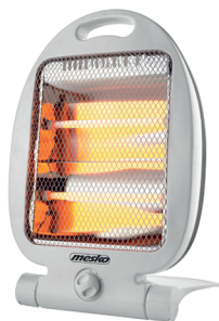
Quartz Heater MS 7710