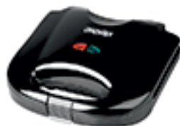
Sandwich Maker MS 3032