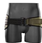
MILITARY OD GREEN /BLACK